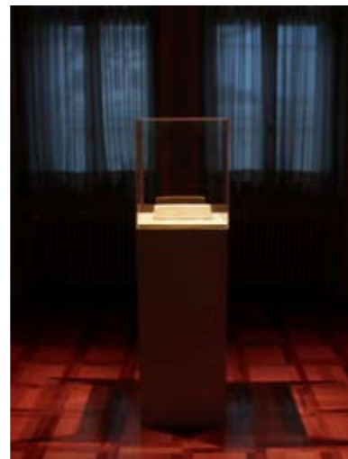
Ansicht in der Villa Planta, an der Jahresausstellung der Bündler Künstlerinnen und Künstler im Bündler Kunstmuseum Chur 2013 /2014

Mit der Arbeit White Gold möchte ich an den Ursprung, an den Wertstoff seines Erfolges erinnern, sozusagen den Grundstein seines Wohlstandes. Die Baumwolle - das weisse Gold.