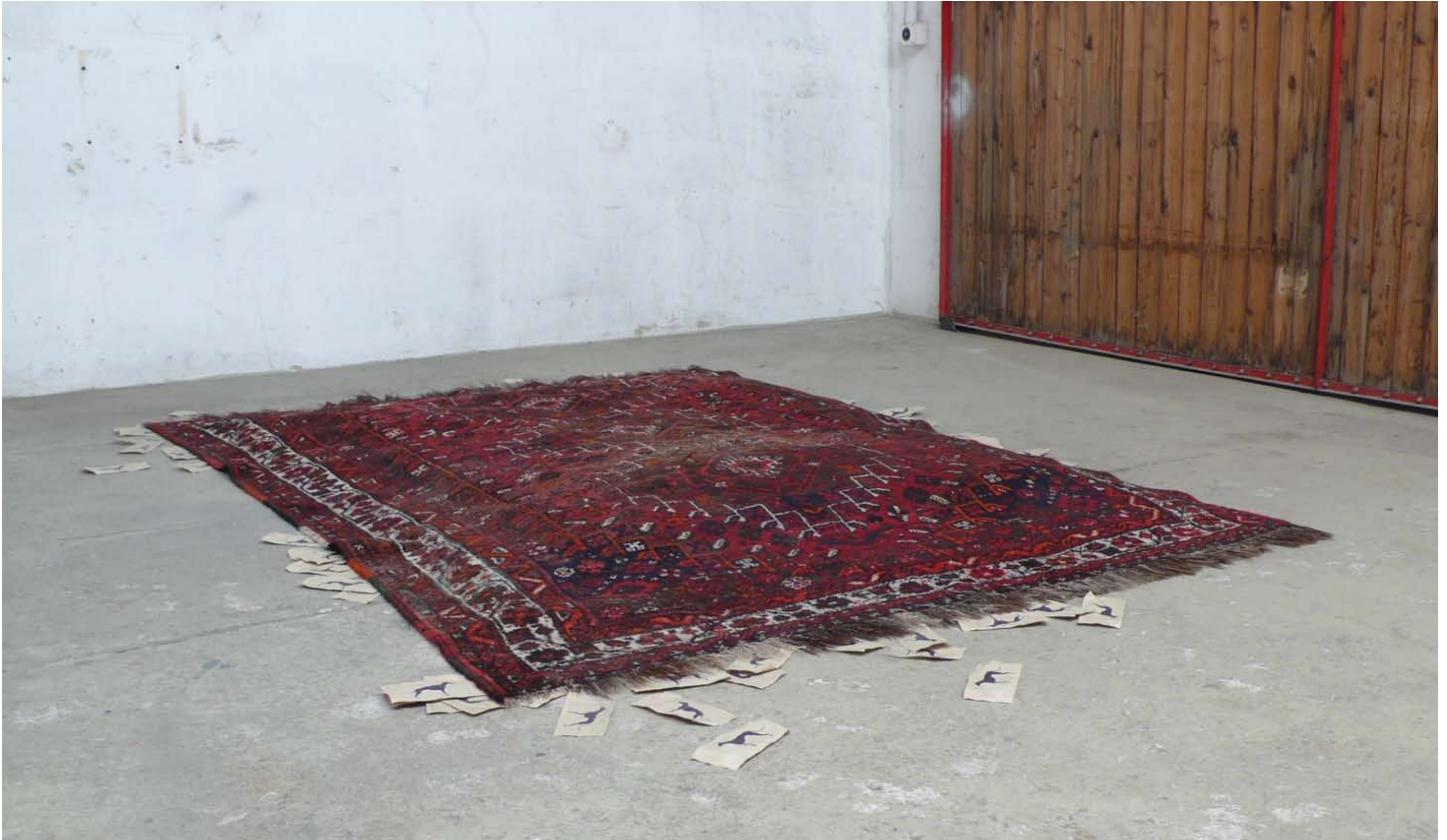
AUF DEN HUND KOMMEN Alles unter den Teppich kehren