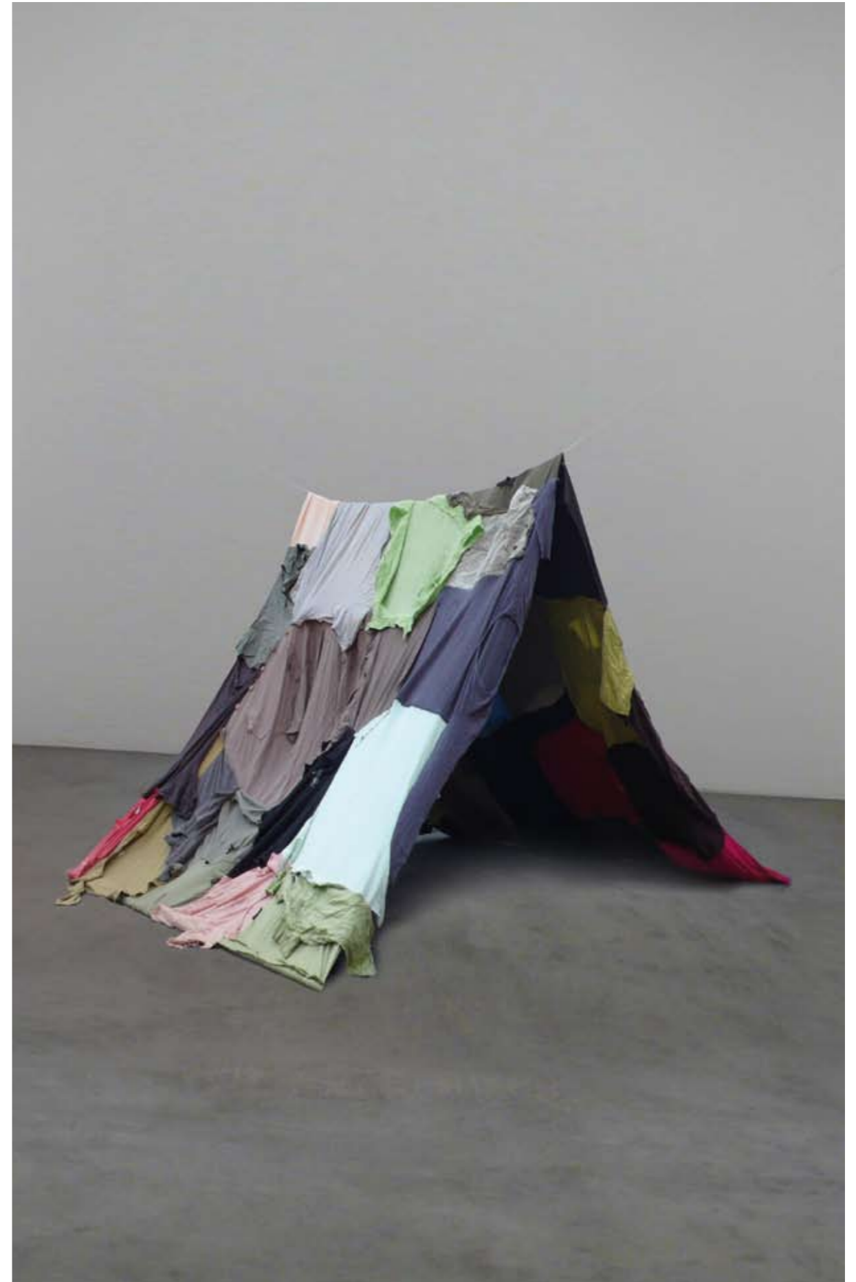
Kleider, Metallstange, Seil 200 x 180 x 180 cm, 2015

Mit «Tent» möchte ich die Heimatlosigkeit darstellen auf der Flucht zu sein und nur das von einem physischem Heim mitnehmen zu können was man auf sich tragen kann. Ich kritisiere aber auch die schnelle, erkäufliche Hilfeleistung.